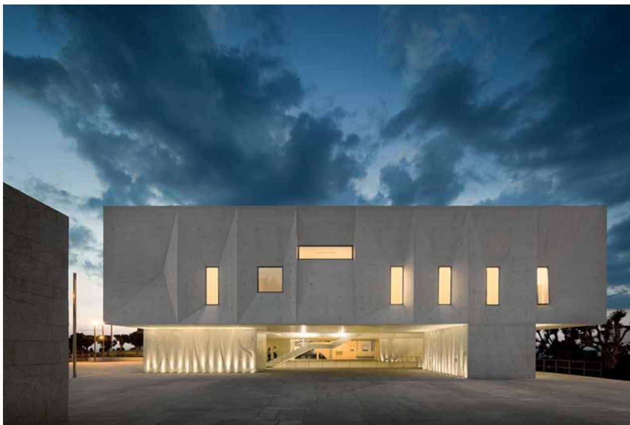
Palácio da Justiça de Gouveia